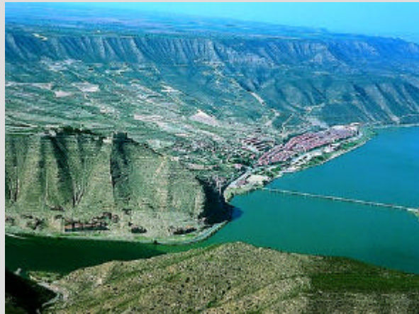
Mequinensa (Baix Cinca)

En l'àmbit cultural els vincles són exclusivament amb la resta dels Països Catalans, lligam majoritari també en els moviments cívics i associatius i, un xic menor, en l'esportiu.